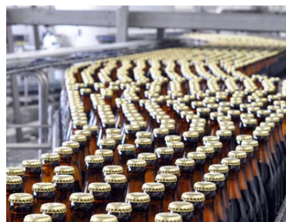
Contrôle d'étanchéité des dispo- sitifs de remplissage (sécurité)