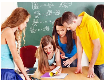
Qualité de l'air en intérieur (Indoor Air Quality)