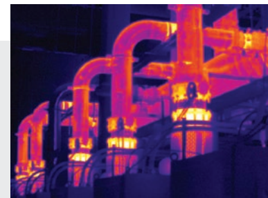
Mise au point MultiSharp™, disponible sur la caméra Ti450