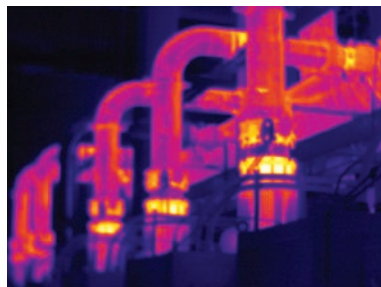
Mise au point manuelle

Une mise au point parfaite—pour chaque objet. De près comme de loin. Mise au point MultiSharp™.