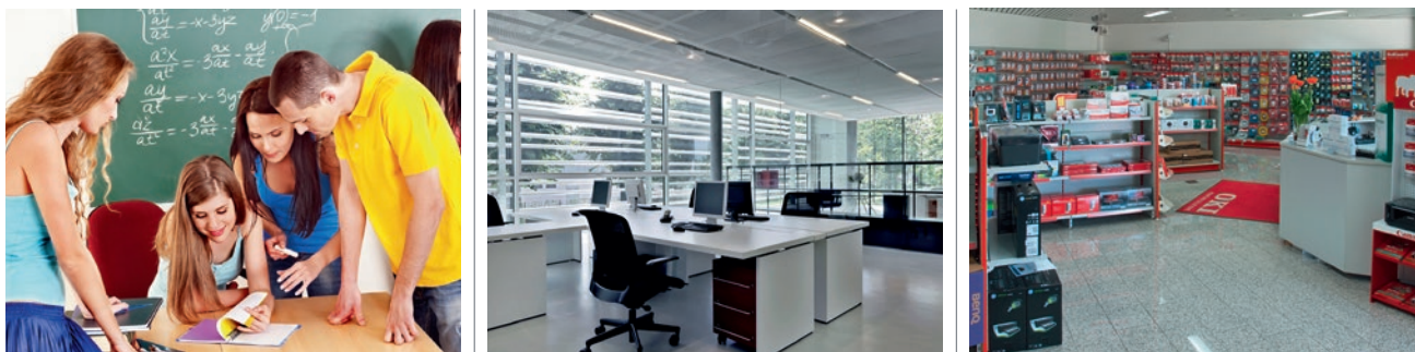
Qualité de l'air intérieur (Indoor Air Quality)